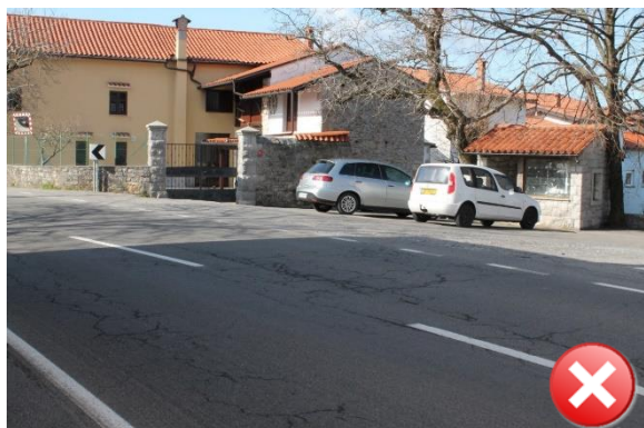
Slika 33: Nevaren odsek iz smeri Kopriva.