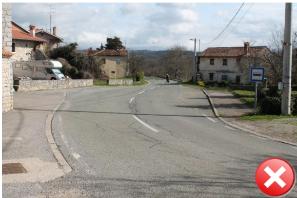
Slika 35: Nevaren odsek iz smeri Štanjel.