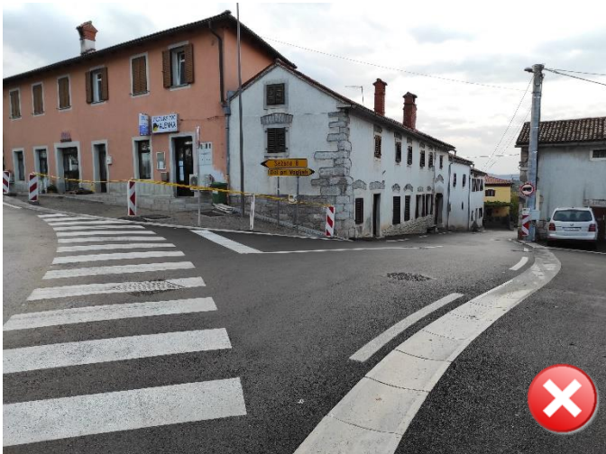
Slika 4: Učenci hodijo do postajališča ob robu ozkega vozišča. V najožjem delu med hišami pas za pešce ni označen.