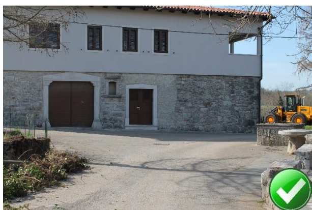
Slika 34: Postajališče ni označeno. Mesto ni problematično, ker vaška ulica ni prometno obremenjena.